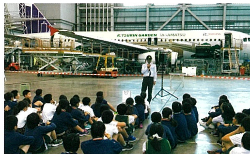
本物に出会う社会科見学