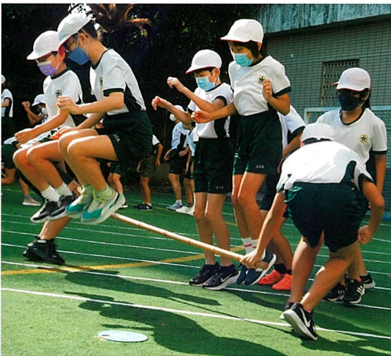
全力で競い合ったスポーツフェスティバル