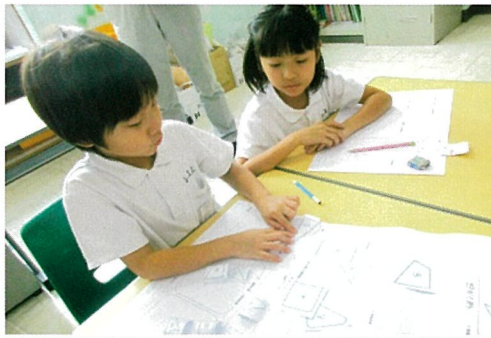
「確かな学力」を育む日々の授業