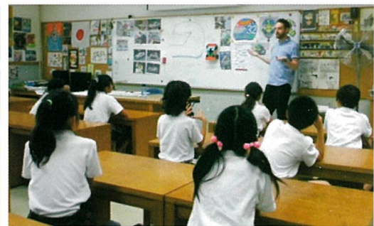
イマージョン教育による図工の授業 (3~6年)