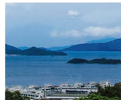
屋上から眺めるトーローハーバー