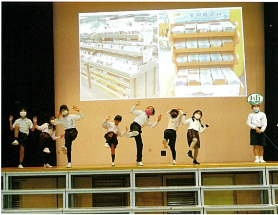
学習の成果を発表するランタナ祭