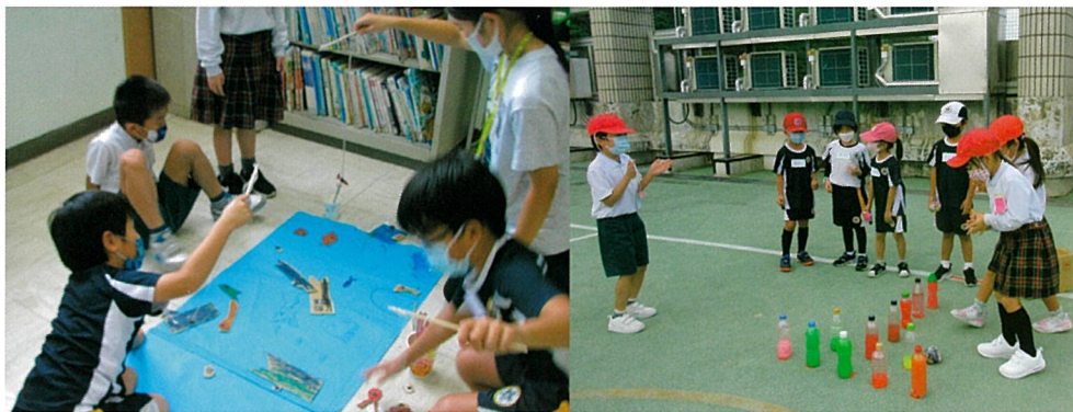
国際学級との交流