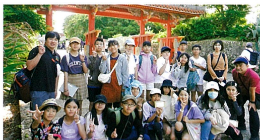
沖縄の修学旅行 (6年)