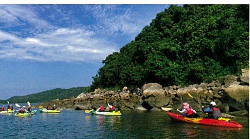
西貢への宿泊学習 (5年)