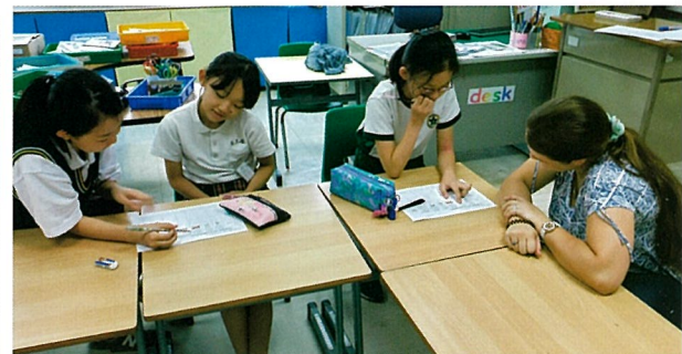
Interview time in English Class (5年)