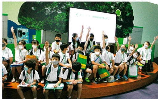
エコパーク見学 4年